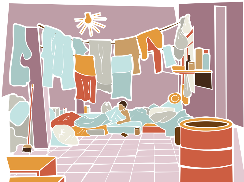
Local inadequado para alojar trabalhadores.