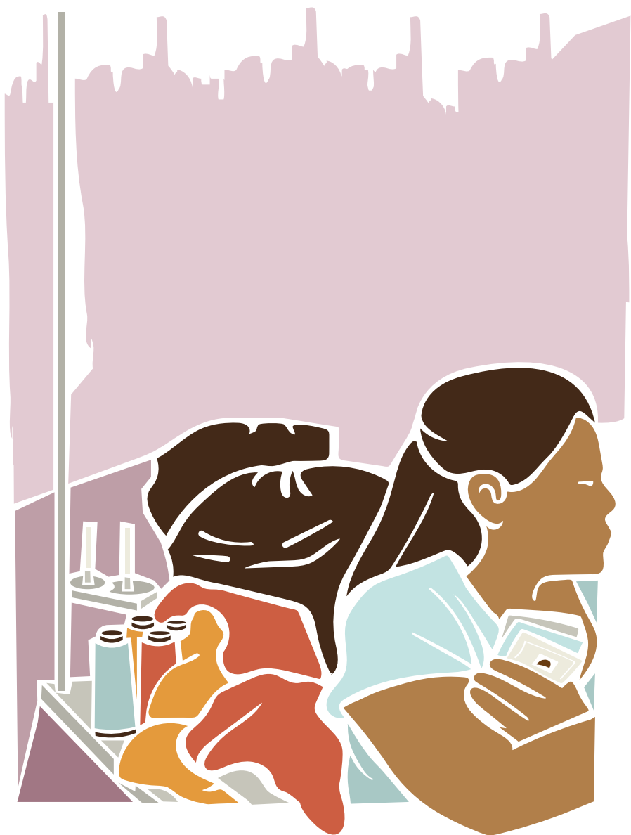
Trabalhadora migrante sem os documentos migratórios regulares em atividade nas oficinas de costura.