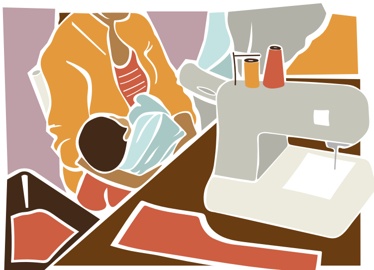
Mãe cuidando do filho durante o trabalho (oficina de costura).